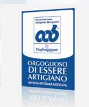
Cod.03 LOCANDINA FORMATO A4