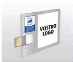
FILE LOGO PER USB CARD