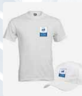
FILE LOGO PER T-SHIRT E CAPPELLINO