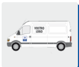
FILE LOGO ADESIVO PER AUTOMEZZI E VETROFANIE

Inoltre potete richiedere il logo "Orgoglioso di Essere Artigiano" per la personalizzazione della vostra immagine aziendale. Qui di seguito vi proponiamo alcuni esempi: