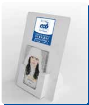
Cod.01 ESPOSITORE CON TASCA

ULTERIORI MATERIALI DISPONIBILI A RICHIESTA